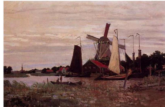
MONET, 1886: ZAANDAM