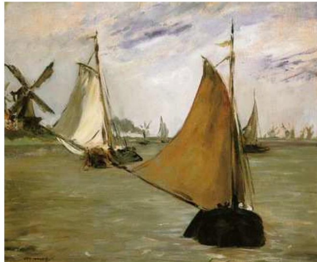
MANET, 1872: VUE DE LA HOLLANDE